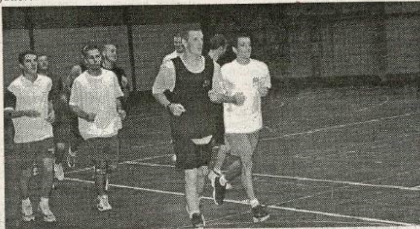
Les basketteurs guingampais ont repris l'entraînement vendredi au hall Dulac.